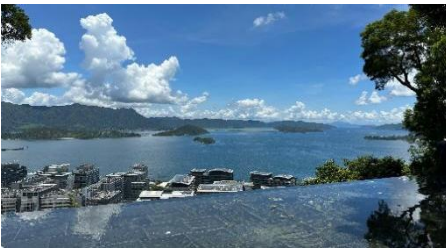
参访交流：香港中文大学