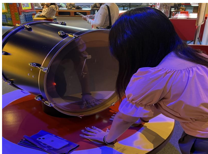
(Hong Kong Science Museum)